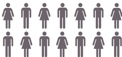
ARBETSRÄTTSENHETEN Enhetschef 13 förbundsjurister