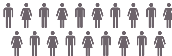
FÖRSÄKRINGSRÄTTSENHETEN Enhetschef 18 förbundsjurister